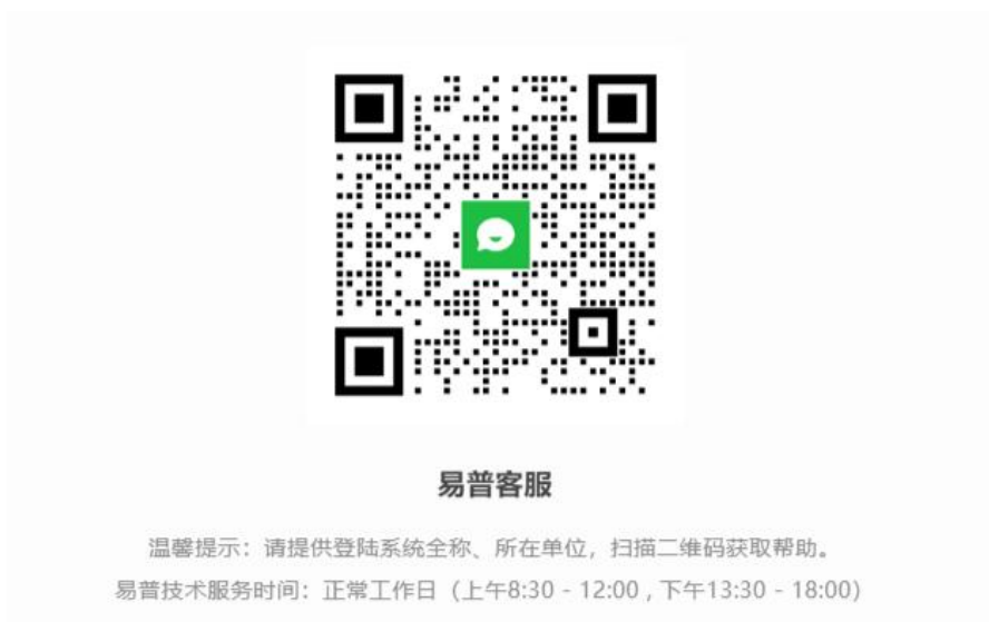
〈技术支持服务二维码示意图〉