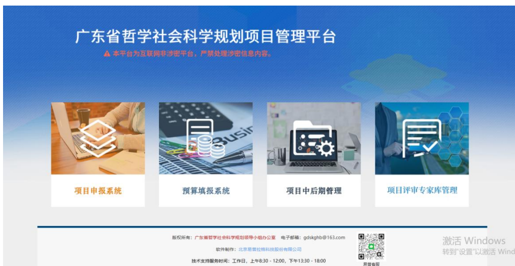
<平台登录界面示意图 1>

在浏览器地址栏输入广东省哲学社会科学规划项目管理平台网址： http://www.gdppssp.com.cn/ ，进入平台首页，点击“项目评审专家库管理”进入，输入单位账号、密码和图片验证码，点击登录即可进入平台。如图所示：