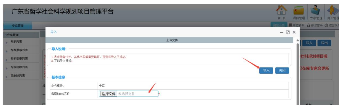
<已在库专家更新示意图 2>