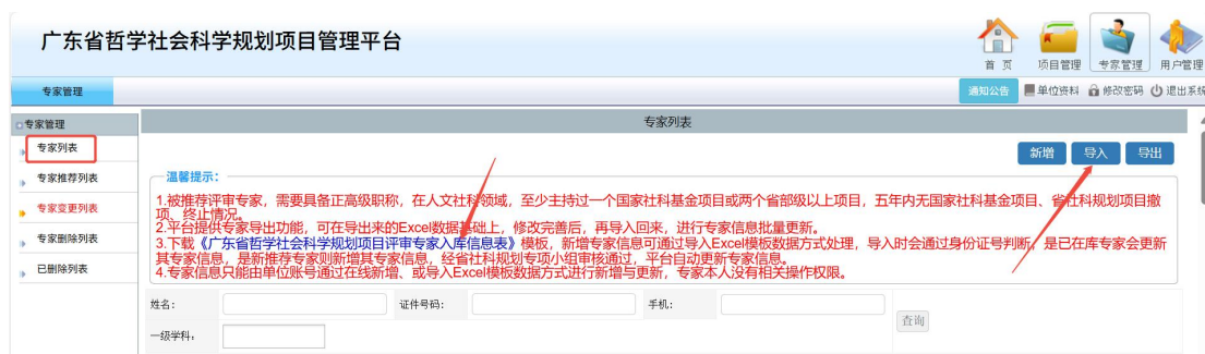
〈推荐新专家入库示意图 1〉

方式三：如单位名下有已在库专家，可在导出表中直接填写新专家信息，无需下载新模板。