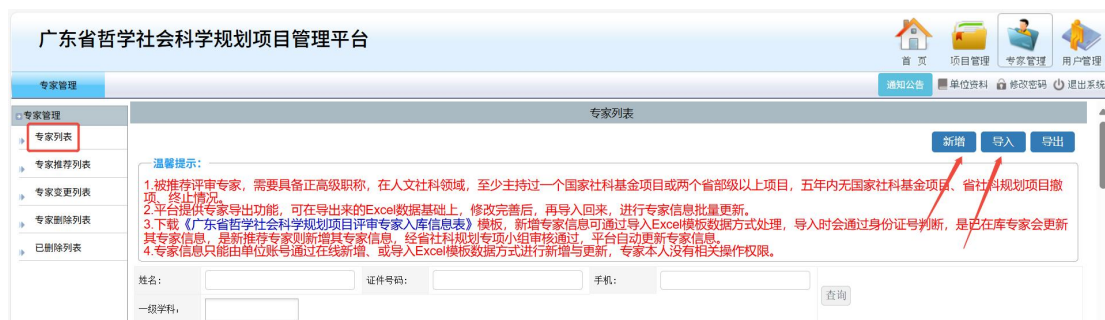
〈推荐新专家入库示意图 2〉