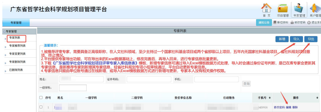
<已在库专家更新示意图 1>