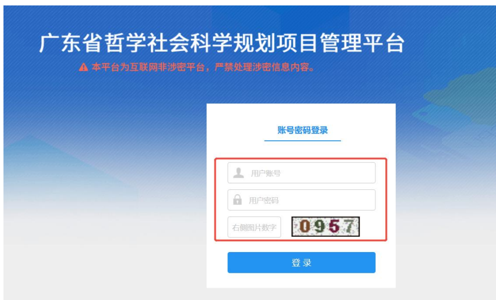
<平台登录界面示意图 2>