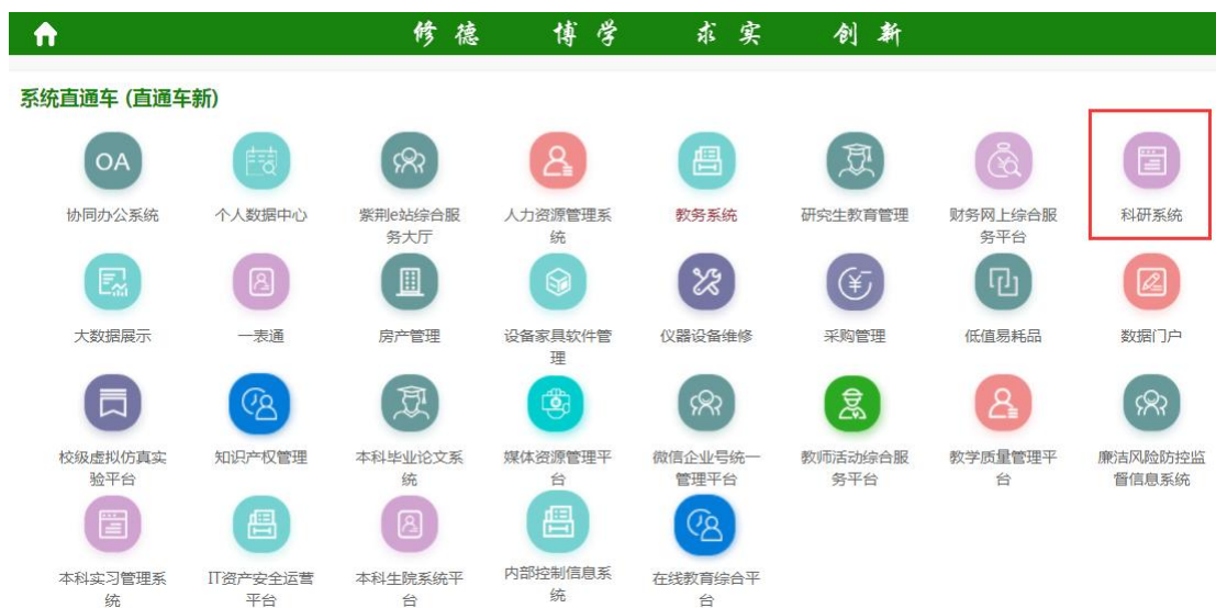
图 1 登录科研院科研系统

1. 入账前项目负责人交合同原件至相关业务科室审核，审核通过后登录“信息门户”-“系统直通车”-“科研系统”。